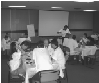
Reunião para tomada de decisões: o grande momento da simulação

softwares de simulação empresarial desenvolvidos pela Bernard Sistemas, criar um ambiente simulado para que os participantes tivessem uma visão sistêmica de uma empresa, com ênfase na integração entre os diversos departamentos. Foram formadas 24 equipes que se dividiram em três grandes grupos e que participaram de seis períodos de simulação.